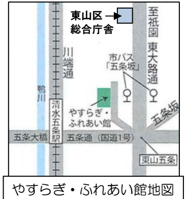
やすらぎ・ふれあい館地図